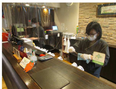
・飛沫防止シート、備品の消毒