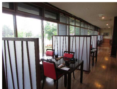
・夕食会場の間隔確保