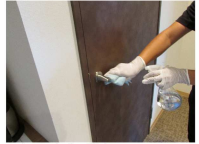
・ドアノブの消毒