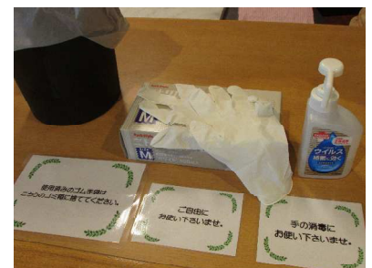
・共有する食事をとって頂く際は、消毒と手袋の着用