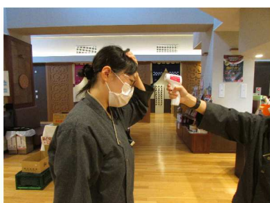
・チェックイン時 検温