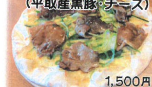
1,500円 テイクアウト1,500円