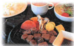
和牛モモカットステーキセット150g