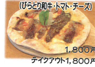
1,800円 テイクアウト1,800円