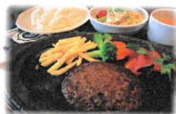
和牛100%ハンバーグ定食