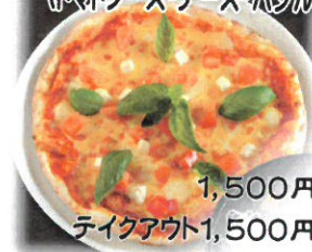
1,500円 テイクアウト1,500円