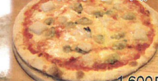
1,600円 テイクアウト1,600円