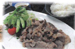
ご飯大盛☆焼肉150g定食