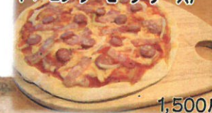
1,500円 テイクアウト1,500円