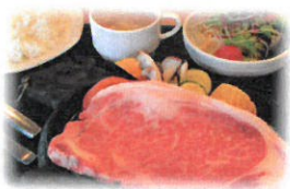
サーロインステーキセット150g